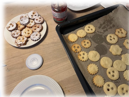
マザーと シスター2人 とクッキー 作り