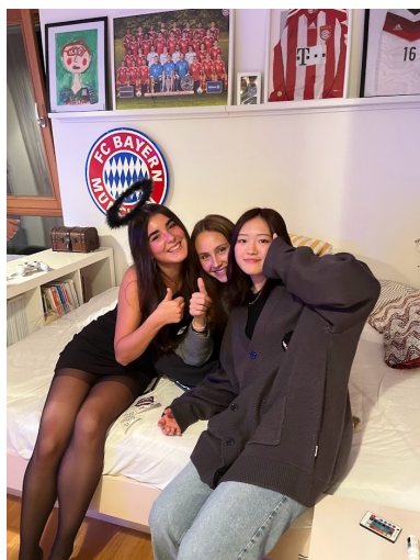
友達と ハロウィンパーティー