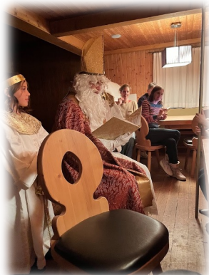
オーストリア 式 サンタさん