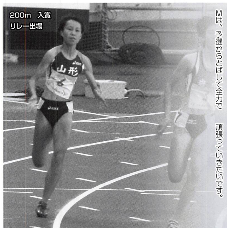
200m 入賞 リレー出場