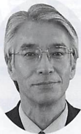
学 校 長