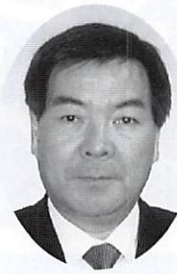
部活動後援会会長