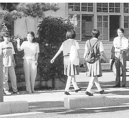
登校の様子を見る服装委員会の方々