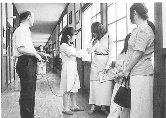
インタビューをする広報委員の方々